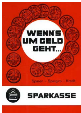
Plakat mit dem Slogan „Wenn's um Geld geht ...“, 1965