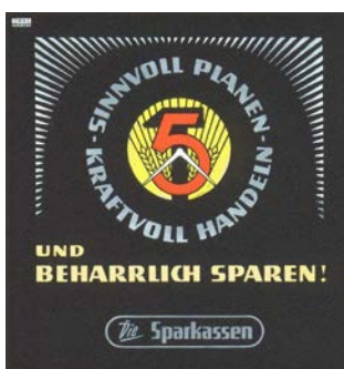
Kino-Werbung der DDR-Sparkassen, 1951