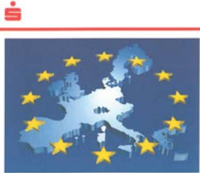
Kundenbroschüre zum Euro, 1996

Der Euro Chancen und Risiken einer gemeinsamen Währung in Europa