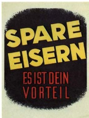
Werbung für das Eiserne Sparen, 1940er-Jahre